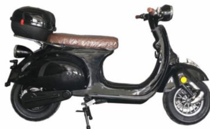
Topkoffer (in kleur van de scooter)