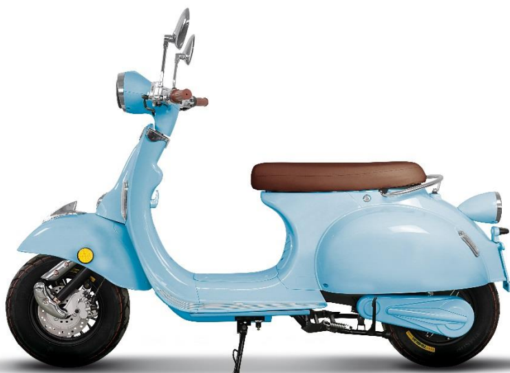
Dusk blue shine