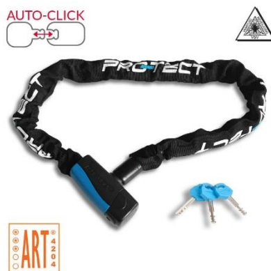
ART 3 kettingslot 120 cm