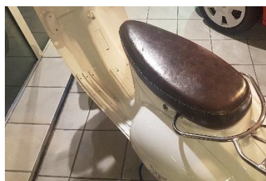
Luxe leren zadel