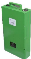
Extra uitneembare accu 20 or 32 AH